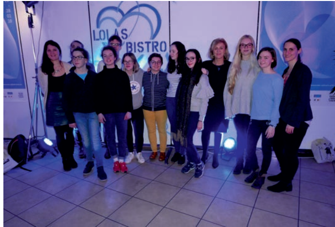
Dt.-frz. Schüler-Jury und Filmblogger beim Max-Ophüls-Festival 2018

Zu den Aufgaben der Botschafterin/des Botschafters gehört die Entwicklung sozio-kultureller Projekte und Begegnungen zwischen Nantesern und Saarbrückern . Insbesondere junge Menschen stehen dabei im Mittelpunkt.