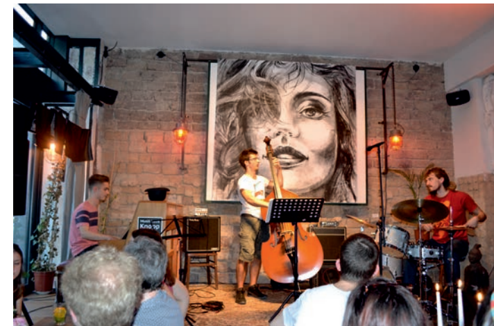
„Ca Va Jazzer – Nantes trifft Saarbrücken“ 2018